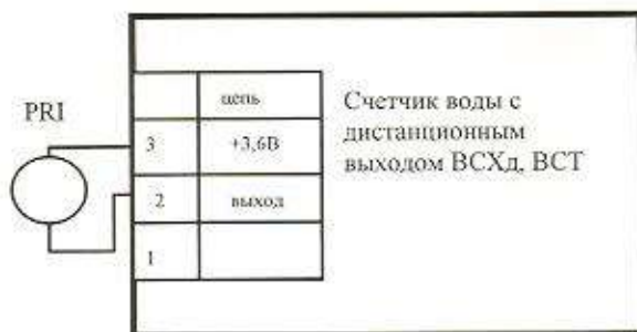
Схема проверки импульсов дистанционного выходного сигнала счётчика холодной воды ВСХНКд.